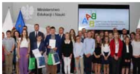
Fot. 2. Uczestnicy gali podsumowującej konkurs w towarzystwie Ministra Edukacji i Nauki oraz kierownictwa KRUS