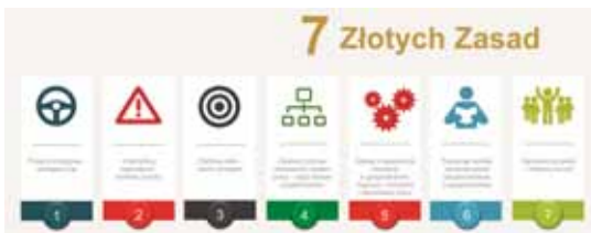
7 złotych zasad Kampanii Wizja Zero

Organizowany od 2019 roku konkurs filmowy dla młodzieży szkolnej i studentów uczelni wyższych, w szczególności tych o profilu rolniczym, ma na celu promowanie bezpiecznych zachowań związanych z pracą na terenie gospodarstwa rolnego oraz popularyzowanie Wizji Zero.