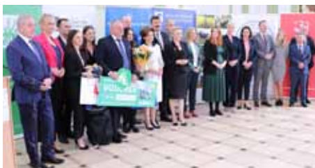
Fot. 1. Laureaci z województwa lubuskiego w towarzystwie przedstawicieli Organizatorów i zaproszonych gości

Ogólnopolski Konkurs dla Dzieci na Rymowanke o Bezpieczeństwie – Bezpiecznie na wsi po raz pierwszy został zorganizowany w 2020 roku. Konkurs skierowany jest do dzieci w wieku od 11 do 14 lat i polega na ułożeniu rymowanki na temat bezpieczeństwa w gospodarstwie rolnym z uwzględnieniem haseł odnoszących się do tematu przewodniego. Został także objęty Patronatem Honorowym Ministra Edukacji i Nauki. Fot. 2